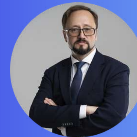
Дмитро Колесніков Віцепрезидент з питань культури