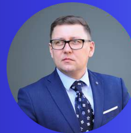
Микола Ларін Віцепрезидент з питань економіки