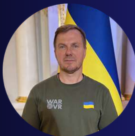
Дмитро Савенко Віцепрезидент з питань екології та охорони природних ресурсів