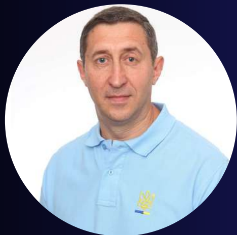
Олег Ситник Президент

АСОЦІАЦІЯ РОЗВИТКУ ТА РЕКОНСТРУКЦІЇ РЕГІОНІВ УКРАЇНИ